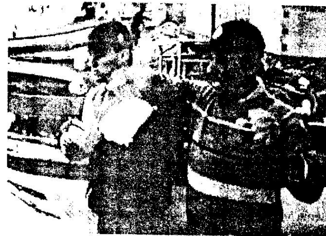
Figura 4 Relato de um informante

O litoral de Florianópolis é um importante centro de captura para a indústria pesqueira do atum. Aproximadamente 70% da captura executada no litoral catarinense, é feita entre a Praia da Pinheira e a Ilha do Arvoredo. Isso reforça a necessidade de uma intervenção imediata no atual quadro da pesca catarinense.